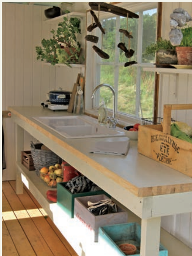
Køkkenet er malet i en lys grøngul (Dyrup Y04), mens kanten på bordpladen står frem i træ, som passer flot til lærketræet. Kogeplade, 219,95 kr. Armatur, 399,95 kr.