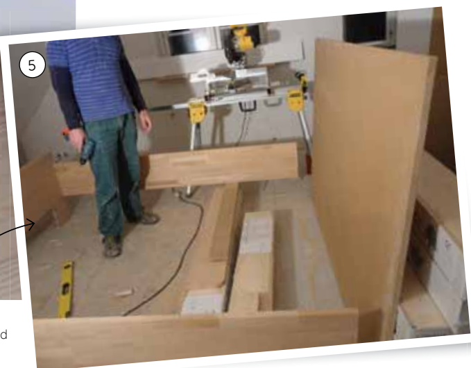
5. Lav til sidst bunden, der her består af en ramme af indvendige lister, der giver boksmadrassen noget at hvile på. Konstruktionen kan evt. afstives med vinkelbeslag i de indvendige hjørner.