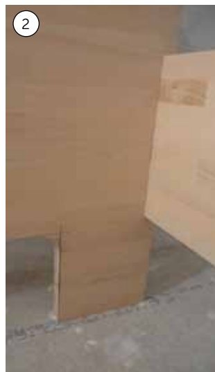
2. Fodenden og siderne, som er dem, man ser mest, er savet ud af en lækker køkkenbordplade i limtræ. Bredden skal være madrassbredde + tykkelsen på siderne + ca. 5 mm. Længden på siderne skal være den samme som madrassen + ca. 5 mm. For at gøre udtrykket lettere kan du som her save ud til ben. Hvis du lader gavlen gå helt ned til gulvet, bliver udtrykket lidt mere massivt. Til gengæld kan du få noget skjult opbevaringsplads under sengen.