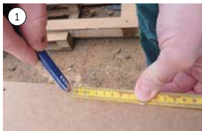
1. Skær gulv og sider ud, så de passer med madrassen. Hovedgærdet er lavet af en 19 mm MDF-plade. Bredden skal være madrassbredde + tykkelsen på siderne + ca. 5 mm.

Det er forholdsvis enkelt selv at bygge en seng, i hvert fald hvis du som her har en god boksmadras at bygge skelettet op omkring. Resultatet bliver ofte mere lækkert end en færdigkøbt model, fordi du får noget, der er skræddersyet til rummet – både med hensyn til stil og mål. Her er sengen bygget i en kombination af MDF-plader og køkkenbordplader i limtræ.