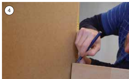
4. Find ud af, hvilken højde du ønsker, sengen skal have, og saml sengen med lim og lange skruer.