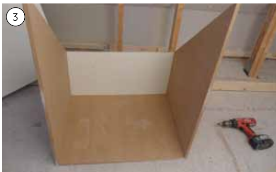
3. Når soklen er sat fast, skæres der ud til skabene, som samles med lim og skruer.