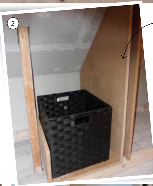
2. Byg først soklen. Vær omhyggelig med at få den i vater, da det er meget besværligt at rette op på hvert enkelt skab senere. Da afstanden mellem spærrene under de skrå vægge er forskellige, skal hvert skab laves efter mål. Det er vigtigt, at de forskellige rum får den helt rigtige størrelse, så kasser, ringbind, skistøvler osv. kan være der uden spildplads. Når du skal skære ud, måles dybde, højde, bredde samt skråvinkel. Da taghældningen er 45 grader, bliver skabenes bagside i samme vinkel.