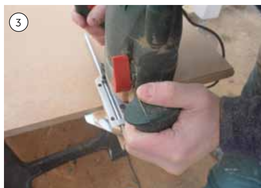
3. Rund sengegærdet af med en overfræser. Det giver sengen en blød og lækker finish.