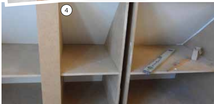
4. Sæt alle skabene på plads under skråvæggene og marker, hvor der skal laves inddækning mellem hvert skab.