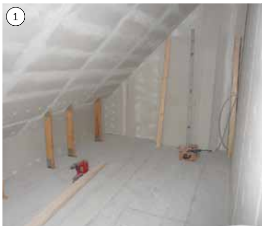
1. Der er masser af plads under de skrå vægge, men da målene er skæve, kan man ikke købe sig til en standardløsning.

De indbyggede skabe under den skrå væg gør, at pladsen udnyttes optimalt, og for at give skabene et lettere udtryk er de bygget op på en sokkel, der er trukket lidt ind. Hver hylde er nøje tilpasset i størrelsen, så de passer til fx kasser, ringbind, skistøvler og kufferter. Skabene er malet i Grå Ral L 34 og grebene i Limegrøn G 16, Blå B17, Lyseblå B 20, alle fra Dyrup. Umalede greb, Silvan, 13,95 kr. pr. stk. Kurve i gummi, Silvan, 360 kr.